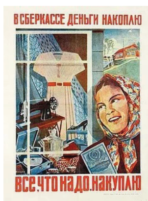
Рисунок 7 – Агитационные плакаты