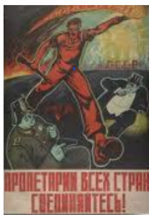
Рисунок 3 – Политический плакат «Пролетарии всех стран, соединяйтесь!»