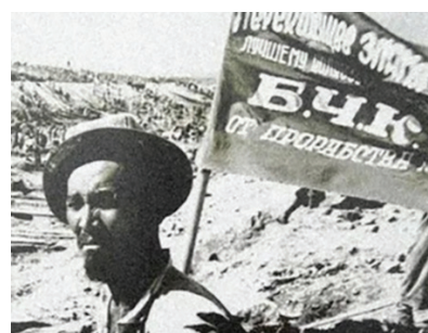
Рисунок 8 – Лозунг строителей БЧК

государственных займов» и т. д. В основном это объявления о выходе нового фильма на экраны, в кинотеатре «Ала-Тоо» – зимний и летний залы, а также объявления о репертуаре в театрах. Встречается иллюстрированная реклама гос. займов, страхования и сберегательных касс, например, с пионером, нарисованным перед барабаном с билетами с заголовком «Вниманию держателей облигаций государственных займов» [8]. Рубрика «государственное страхование» занимает полстраницы в конце газеты, где в стиле комикс рассказано о страховании жизни – индивидуальном и коллективном, а также страховании домашнего имущества и т. д. [9].