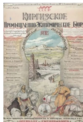
Рисунок 4 – Плакат Киргизского промышленного бюро

политико-агитационный характер. Так, вербальная реклама в газете «Голос пролетариата» органа Пржевальской партии большевиков насыщена лозунгами «Пролетарии всех стран, соединяйтесь!» [3] (рисунок 2) и агитациями за профессиональное движение и рабочую кооперацию [4]. Плакат с аналогичным лозунгом «Пролетарии всех стран, соединяйтесь!» олицетворяет победу нового строя над старым, когда пролетарий решительной поступью идёт к новым поставленным целям, к новой жизни, разрушая на своём пути оковы капитализма (рисунок 3).