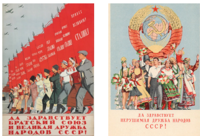
Рисунок 10 – Плакаты, посвящённые дружбе народов

Необходимо отметить, что в этот период кыргызские художники-графики уделяют большое внимание тематике изобразительной рекламы, это темы, связанные с работой комсомольских и пионерских организаций, со строительством коммунизма, с дружбой народов и т. д. Через искусство соцреализма плакат продолжает изображать жизнь процветающего общества и счастливого советского народа, народа-строителя коммунизма (рисунок 10).