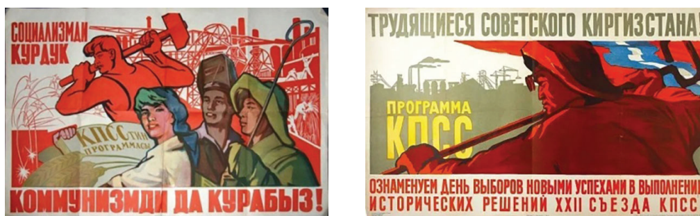
Рисунок 11 – Кыргызские политические плакаты 1962 г.

Таким образом, авторский вывод сводится к тому, что именно переломные исторические процессы в стране повлияли на средства массовой информации и визуальную коммуникацию, а средства массовой информации и лейтмотивы советского агитационно-пропагандистского плаката стали рупором новой власти и способствовали достижению политических целей. Продвижение и популяризация новых жанров советского агитационно-пропагандистского и просветительского плаката в начале XX века способствовали поиску новых идей и подходов в визуальной информации, именно в начале прошлого века зарождается новый стиль – советский соцреализм, через призму которого изображались процветающее и счастливое общество людей, строящих светлое будущее, и именно соцреализм всегда был важной частью официальной идеологии и пропаганды советской власти [5].