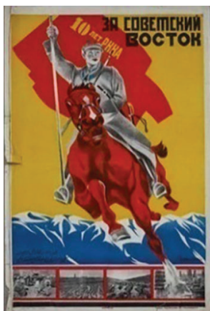
Рисунок 1 – Политический плакат за свободный Восток к 10-й годовщине Советской армии