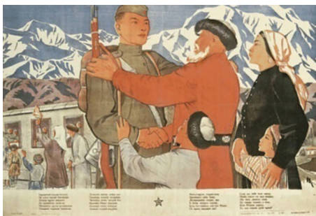
Рисунок 9 – Плакат 1943 г. Художник Н. Кочергин

Особенности изобразительной рекламы военного времени в том, что плакаты создавались по всей территории СССР, все республики включились в этот процесс. Так, известный плакат «Родина-мать зовёт!» был создан грузинским художником И.М. Тоидзе. Плакаты военного времени служили для отражения в доступной форме ситуации на фронте, они помогали населению уйти от пораженческого настроения, воодушевляли массы на борьбу с врагом. Широко известный лозунг «Всё для фронта, всё для победы!» мобилизовал население на борьбу, показывал, что их труд и выносливость принесут долгожданную победу советскому народу. Самые распространённые темы военного плаката – это призывы бороться до конца и не сдаваться, быть бдительными и т. д. Героями военных плакатов стали солдаты и военврачи. Плакат «Сынок, защити своих мать и отца» рассказывает о юноше, уходящем на фронт из горного киргизского аула, и содержит информацию о том, что на защиту своей Родины встала вся многонациональная страна (рисунок 9).