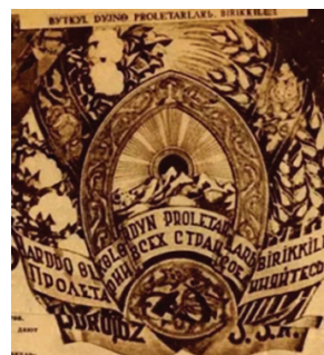
Рисунок 2 – «Пролетарии всех стран, соединяйтесь!»