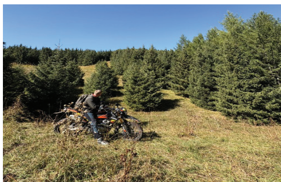
Рисунок 3 – Лесные культуры в урочище Бель в 2026 году

Анализ представленных в таблице 2 данных показывает, что таксационные показатели лесных культур существенно зависят от густоты посадки. Наибольшее значение среднего диаметра обнаружено при размещении по 5 семян на площадке (5 см), а также в опыте по 4 сеянца (4,5 см). По мере увеличения густоты обнаружена тенденция к снижению диаметра: при 6–8 сеянцах на площадке от 4,1 до 4,23 см, а при максимальной густоте (9 семян) зафиксировано резкое снижение до 2,44 см. Это свидетельствует об усилении внутривидовой конкуренции за ограниченные ресурсы, прежде всего, влагу и элементы питания (рисунок 3).