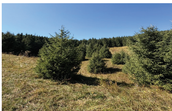
Рисунок 2 – Лесные культуры из ели тьянь-шаньской в 1926 году на южной экспозиции склона. Выявлено уменьшение стабильности насаждения