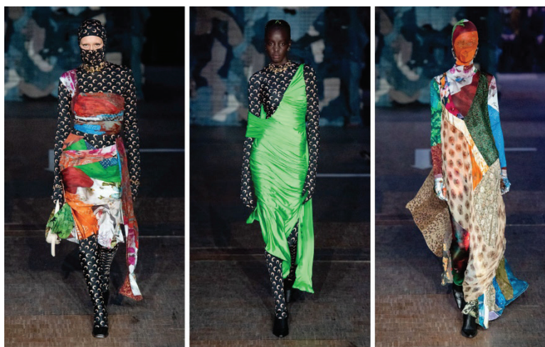
Рисунок 2 – Collection Marine Serre

Ключевые замечания: этот кейс показывает, как апсайклинг – не просто экологическая стратегия, а художественный жест. Можно использовать как модель для студенческих заданий: дать старые вещи и создать арт-объект.