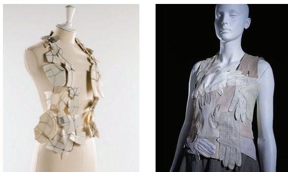
Рисунок 1 – Collection Maison Margiela

Материал: использование найденных/вторичных материалов: винтажной кожи, подкладок, бумаги, металла, старых ремней и т. д. [6].