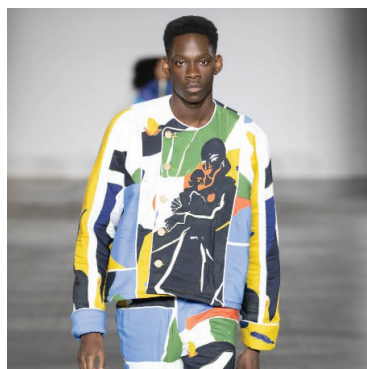
Рисунок 3 – Collection Bethany Williams

Материал: использует переработанные и органические материалы, сотрудничает с социальными проектами, перерабатывает бумагу, упаковку, обрезки ткани [10].