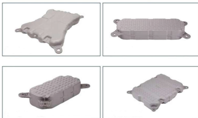
Рисунок 3 – Конструкция плавучей платформы второго класса

Различные варианты конструктивного исполнения понтонов второго класса представлены на рисунке 3.