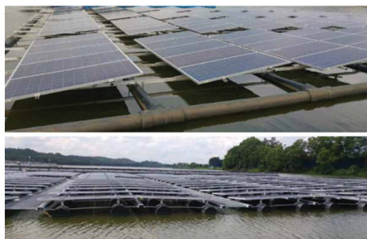
Рисунок 2 – Конструкция плавучей платформы первого класса

Отдельные модули платформы соединяются между собой посредством шарнирных соединений или фиксирующих штифтов, что позволяет формировать крупные модульные массивы без применения дополнительной несущей рамы. Такая модульная структура облегчает транспортировку и монтаж станции, а также обеспечивает возможность адаптации платформы к геометрии конкретного водоёма.