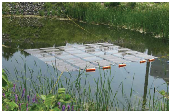
Рисунок 5 – Конструкция гибкой погружной ПСЭС

В первом случае используются тонкоплёночные солнечные элементы, обладающие высокой гибкостью и небольшим весом. Такие панели могут размещаться непосредственно на поверхности воды, а их положение стабилизируется с помощью боковых поплавков или кольцевых буйев. Подобные системы рассматриваются прежде всего для морских и офшорных энергетических проектов, где требуется высокая адаптивность конструкции к волновым нагрузкам. Один из вариантов реализации гибкой платформы показан на рисунке 5.