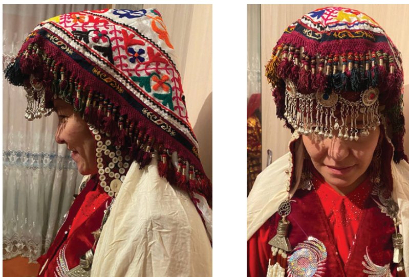
Рисунок 6 – Нарядный памирский головной убор (элечек)

У памирских кыргызов головные уборы носят преимущественно утилитарный характер. Основная задача платков и шапок – защита от холода, ветра и палящего солнца. Женщины носят их в повседневной жизни, что подчёркивает их практичность и простоту. Тем не менее на праздники и церемонии могут использоваться более украшенные платки или головные уборы (рисунок 6).