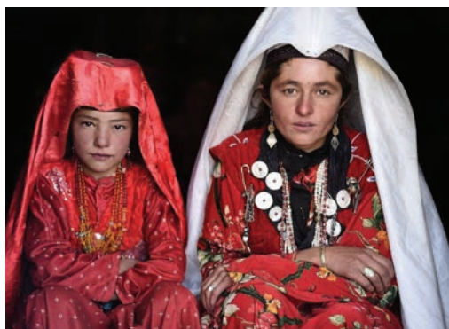
Рисунок 2 – Одежда девочки и женщины Памира