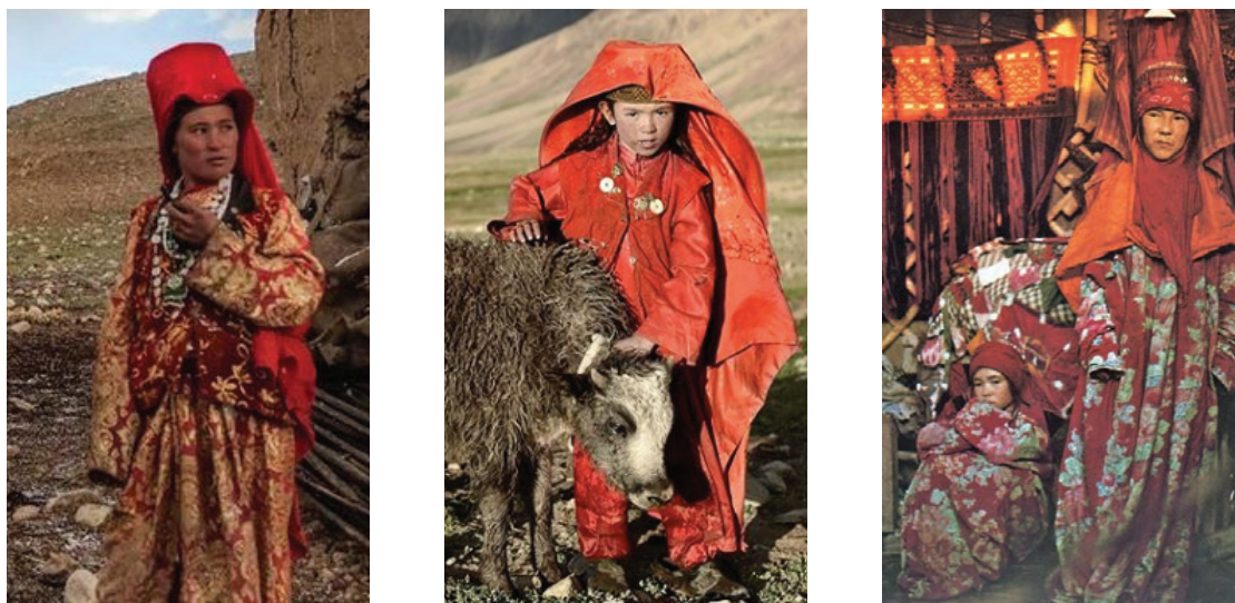
Рисунок 1 – Форма и силуэт

Симметрия и асимметрия. Модели в основном симметричны. Асимметричное начало в симметричной форме усиливается благодаря развивающимся на ветру головным уборам.