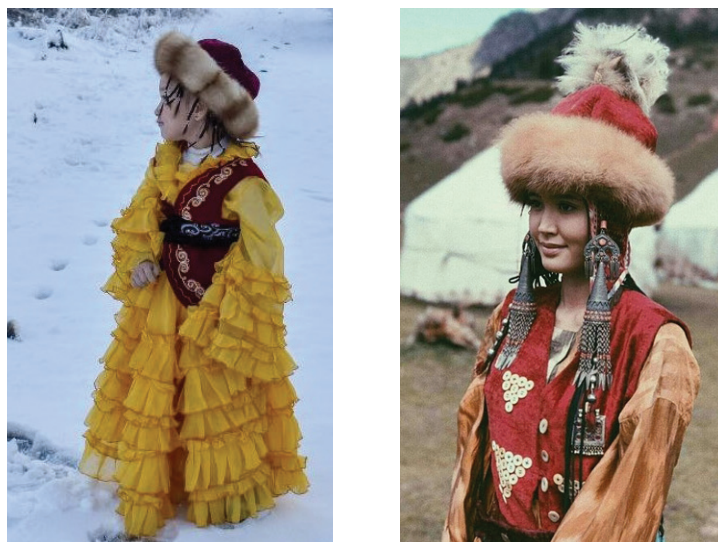
Рисунок 4 – Кыргызские девичьи тебетей