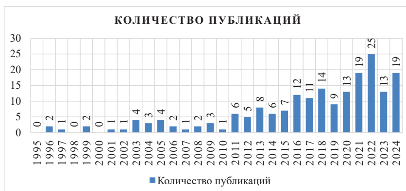
Рисунок 1 – Динамика научных публикаций, посвящённых исследованию КПРФ (1995–2024 гг.)

Условно можно выделить четыре основных этапа историографического осмысления партии: